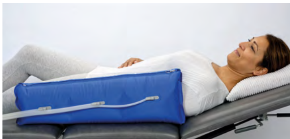
Armmanschette mit 3 Luftkammern durchgehender Reißverschluss Oberarmumfang bis 60 cm, Länge 67 cm

Der durchgehende Reißverschluss bei Arm- und Beinmanschetten erleichtert Anlegen und Reinigen. Ein zusätzlicher Klettverschluss ermöglicht eine optimale Anpassung im Bereich des Oberschenkels. Die Hüftmanschette ist individuell größenverstellbar.