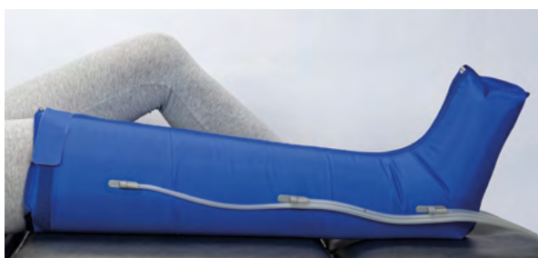
Beinmanschette mit 3 Luftkammern durchgehender Reißverschluss, Klettverschluss Größe M: Oberschenkelumfang bis 70 cm, Länge 85 cm Größe L: Oberschenkelumfang bis 83 cm, Länge 85 cm