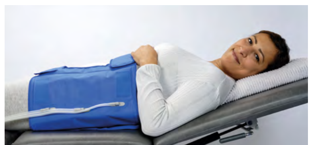
Hüftmanschette mit 6 Luftkammern variabler Klettverschluss auf Vorder- und Rückseite Hüftumfang einstellbar bis 150 cm, Länge 38 cm

In begründeten Fällen übernimmt die Krankenkasse die Kosten des Gerätes. Der behandelnde Arzt überwacht die Therapie.